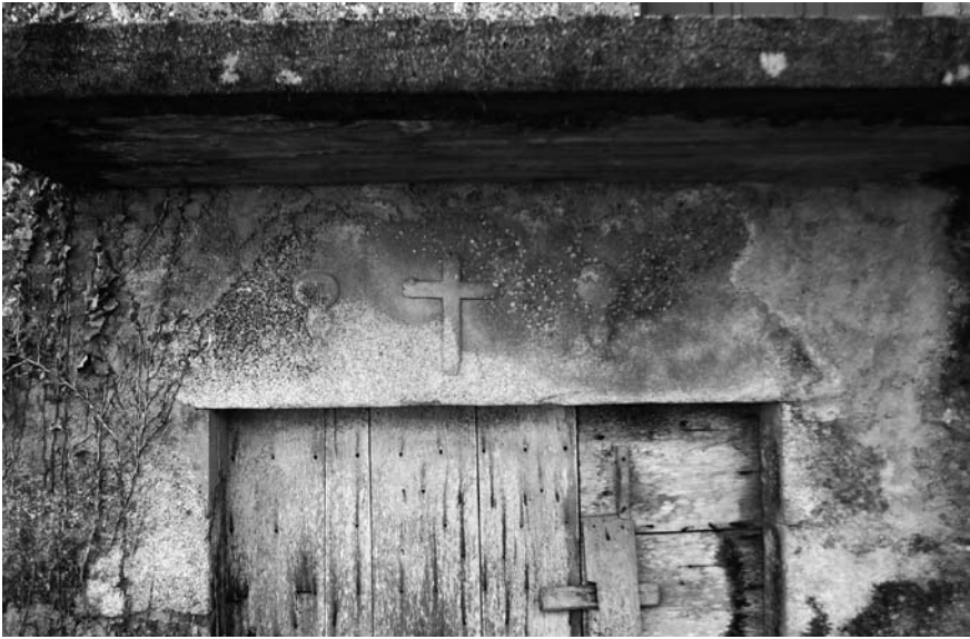
Entrada lateral da casa de Vilalén.