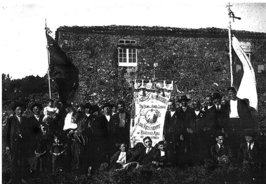
Foto diante da casa de Vilalén co estandarte.