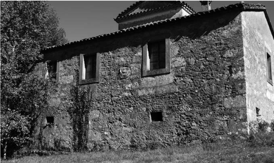
Casa de Vilalén.