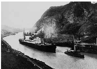
La inauguración del Canal de Panamá el 15 de Agosto de 1914.

dólares de la época, cuyo valor en relación al precio del oro serían hoy 16.000 millones de euros.