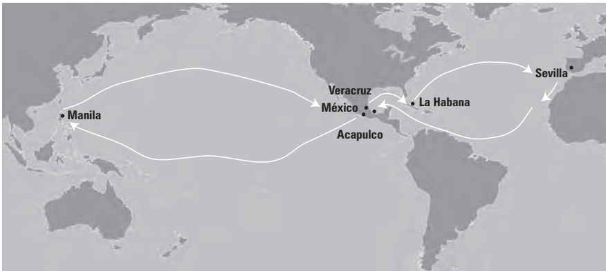
Comercio España - Filipinas.

En el Océano Pacífico es muy amplia la presencia de gallegos. Desde las primeras expediciones alrededor del mundo, como en el caso de Magallanes, hasta en el inicio de la ruta a Filipinas, que con el puerto de Acapulco como destino intermedio permitió la llegada de las mercaderías orientales a la península después de una larga travesía de Filipinas al puerto de Acapulco y de ahí por tierra con las famosas rutas de la arriería al puerto de Veracruz en el Atlántico para continuar por la Habana distribuyéndose estas mercaderías desde Sevilla y el puerto de Cádiz a todos los dominios españoles y mercados europeos 2 .