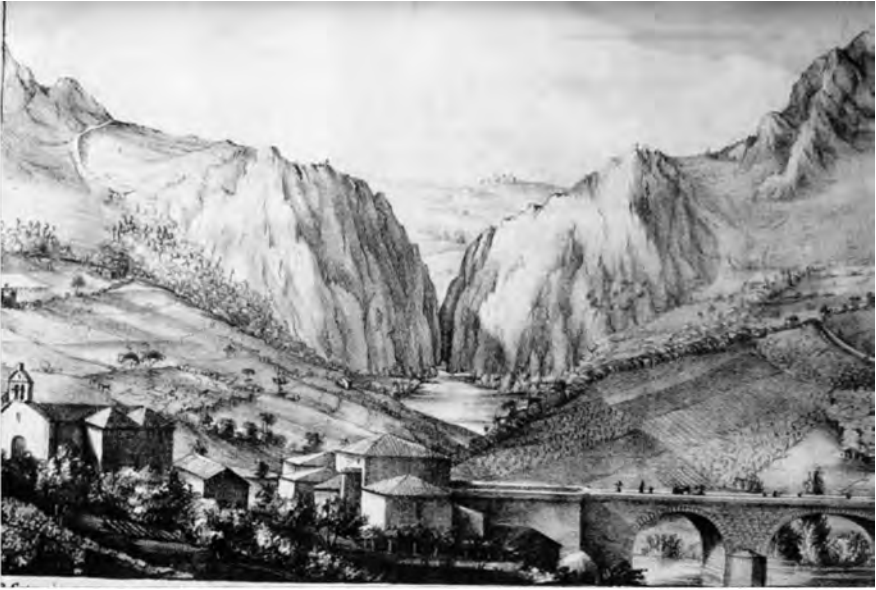
FIGURA 2. Litografía da gorxa de San Xoán da Cova, por Ramón Antonio Gil Rey no Semanario Instructivo , 1838 (Puertas, C. 2008).

Rúa Figueroa, que ademáis de escritor de dramas e contos, amosaba unha boa formación científica, recoñecía o carácter precursor deste tipo de descrições por parte de Humboldt, na súa viaxe polos Andes, e de De Saussure, polos Alpes e, así mesmo, destacaba o carácter singular desas paisaxes “que no carecen de la imponente magestad con que están revestidas esas obras del Criador” sinalando que: