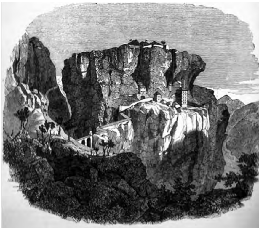
FIGURA 6. Desfiladeros de La Coruña. Semanario Pintoresco Español . 13 de abril de 1851.

Vienen en apoyo de esta opinión otros depósitos de arena, que se hallan en las laderas de la Ulla baja, donde jamás se ha supuesto la existencia de lago alguno. Por otra parte, ni en el recinto de Donas, ni en otro punto de los que debieron constituir el fondo del lago, se han descubierto hasta ahora depósitos lacustres, ni otro indicio de semejantes formaciones.