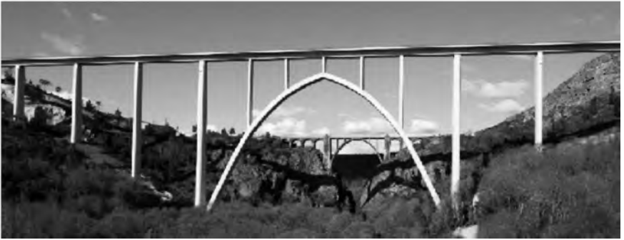
FIGURA 10. A nova ponte do AVE sobre o Ulla na liña férrea Santiago-Ourense.