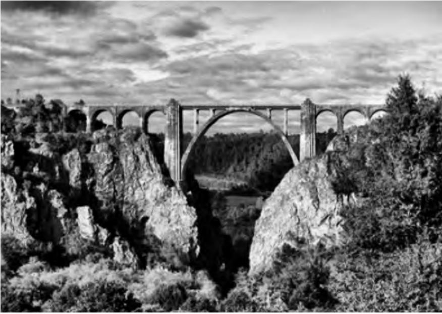
FIGURA 9. Viaducto da liña férrea Santiago-Ourense (1958).

Finalmente, non se podería rematar este traballo que ten como base a paisaxe de San Xoán da Cova sen mencionar a construción do viaducto da liña férrea Santiago-Ourense en 1958 (Figura 9). Poderíase considerar, por algúns, como un proceso desacralizador. Unha sorte de atentado contra natura . De todas maneiras, sería tamén unha ilusión vá que iría en contra da corrente normal da evolución das paisaxes galegas que no transcurso da historia foron sempre constituíndose a partir dun proceso fundamente humanizador (Otero Pedrayo, 1955). Cada época incorporou os seus elementos e, aínda que temos a tendencia a reter e valorar só, como unha foto fixa, aquelas paisaxes que foron coma un telón de fondo de determinados episodios do noso percurso vital, a realidade seméllase máis ao cine, co seu dinamismo e cambio constante.