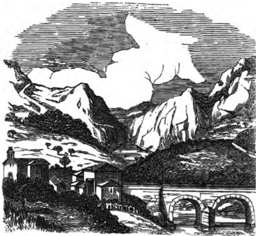
(Paso del río Ulla por San Juan da Cova.)

FIGURA 5. Paso del río Ulla por San Juan da Cova. Neira de Mosquera, A. Semanario pintoresco Español , 9 de enero de 1855.