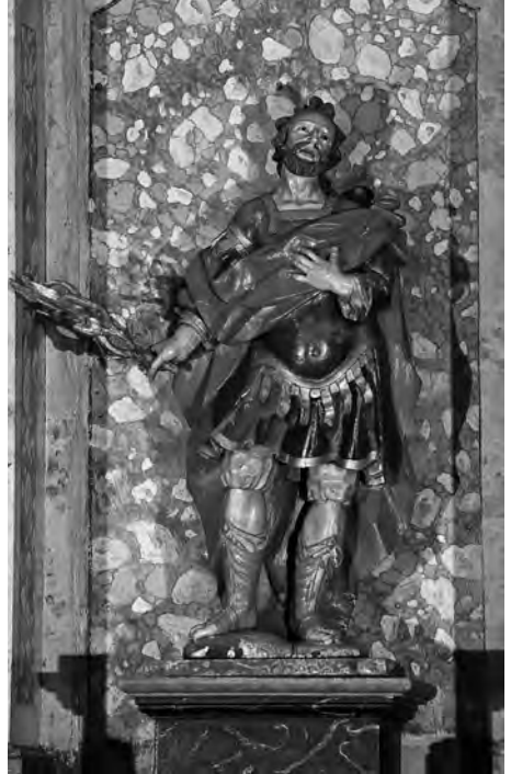
Imaxe de San Xiao.