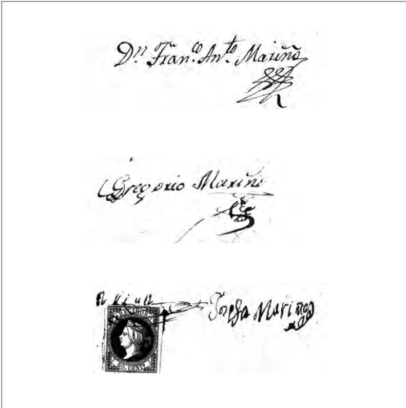
Firmas de algúns Mariño.

Figuerod “ como capelán de Santiago de Saa de Páramo (Sarria) e dos seus anexos. Ordenouse de grado e epístola en 1826 desempeñando o cargo de capelán en Callobre, logo foi ordenado presbítero en 1827 continuando como reitor da parroquia de San Martiño de Callobre ao mesmo tempo que seguía como mordomo e administrador dos bens da casa Grande de Figueroa ata o momento do seu óbito, feito acaecido en San Martiño de Callobre o 8 de marzo de 1828.