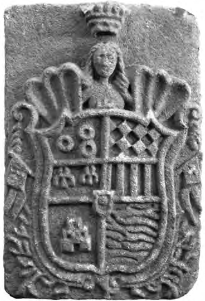
Escudo dos Mariño.