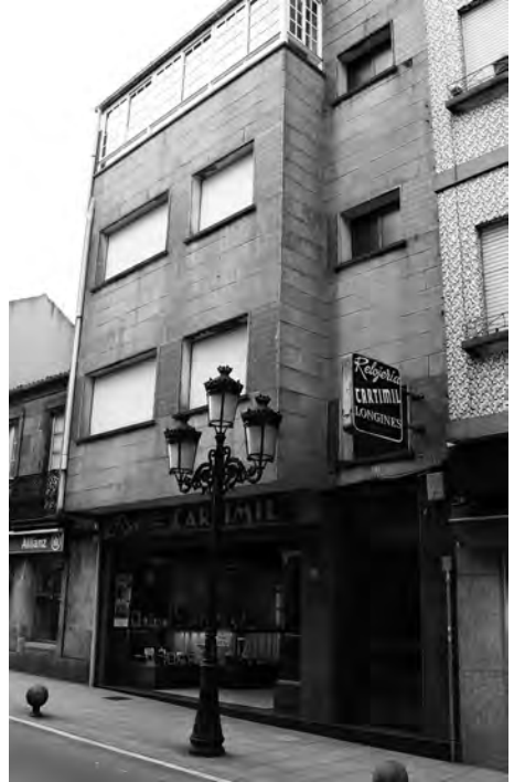
A casa na actualidade.