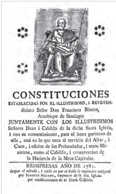
Portada das Constitucións Sinodais do Arcebispo Blanco. Reimpresión de 1781, por Ignacio Aguayo.

polo menos en aparencia, xa que exercía tamén como escribán, tal e como reflectimos supra.