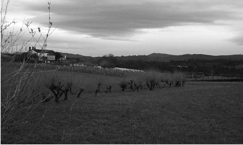
Estrato de nubes sobre o Val do Ulla o 21 de decembro de 2000.

Por iso son mellores os enxamios de marzo e abril porque chegan xa en primavera e as abellas teñen de que alimentarse.