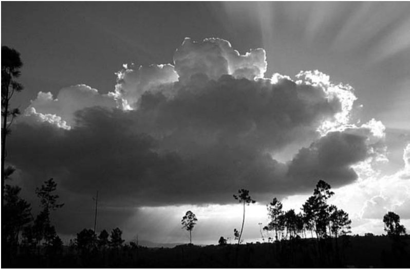
Un cumulonimbo fotografado en Socastro (San Mamede de Ribadulla, Vedra) o 17 de setembro de 2000.