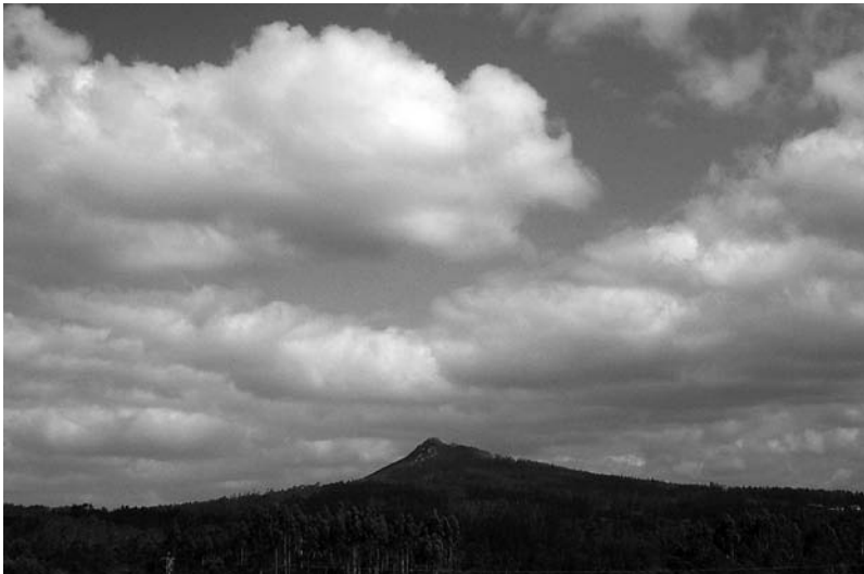
Cúmulo sobre o Pico Sacro o 28 de abril de 2002. Se o Pico Sacro tivese posta a touca ou capelo as nubes ocultarían a cima e iso sería sinal de chuvia.

A touca (pano da cabeza) ou capelo (sombreiro) ós que se refiren algunhas destas coplas e refráns aparecerá a meirande parte das veces pola entrada de aire húmido desde o Atlántico. As masas de aire que veñen do sudoeste, que son as que deixan maiores cantidades de chuvia entran polo Val do Ulla. Ó atopar o Pico Sacro a masa de aire vese forzada a ascender de xeito que se enfría lixeiramente ocasionando a condensación e a presenza de nubes ou néboas que ocultan a cima do monte. Polo tanto esta sería unha primeira pegada da chegada de masas de aire do sudoeste. A copla e o último refrán presentan unha certa contradición: normalmente será de aplicación a copla, posto que o mais habitual en Galicia son as chegadas de fronte frías que teñen máis cantidade de auga; as fronte cálidas pasan normalmente máis ó norte.