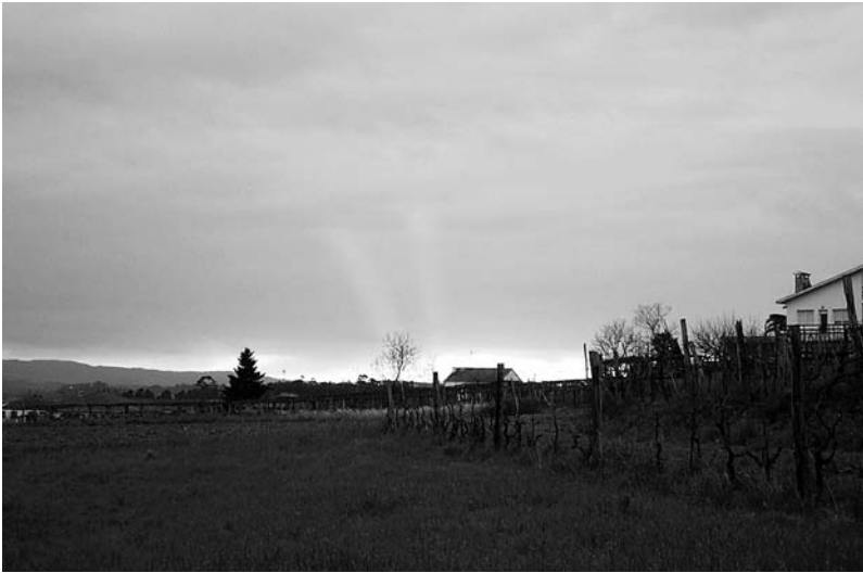
Un solpor coma este, do 24 de febreiro do 2002, no que se ven nubes de cor vermella, indica posibilidade de chuva para o día seguinte.

en zonas onde abunda máis que na Ulla a gandería ovina. A palabra rubiás sería máis propia da provincia de Ourense que do Val do Ulla.