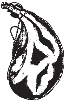
Bota de viño. Debuxo de Juan Carlos Vilar Pérez.

Os arrieiros almacenaban o viño ordinarimente nas súas propias casas. Había tamén algúns que construían casetas ou almacéns, para a súa comodidade, en lugares próximos ao camiño dos arrieiros, onde gardaban o viño para despois repartilo polo miúdo ás tabernas ou casas particulares. Nestes lugares almacenaban o viño en bocois, medios bocois e mesmo pekellos.