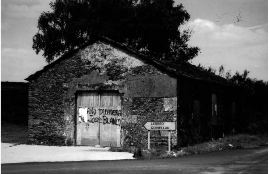
Caseta de Xosé Andiñón Garrido.

Na estrada de Forcarei a Codeseda, no cruce que leva a Levoso, tiñan unha caseta onde almacenaban o viño que traían do Ribeiro.