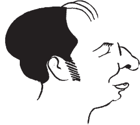
Visto por Seoane.