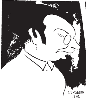
Visto por Cebreiro.