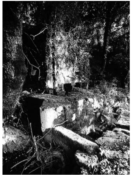
Muíño e pesqueira de Silva.